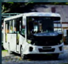
ПАЗ-320405 (VECTOR NEXT)

Максимальная длина обеспечивает наилучший комфорт при переездах на дальние расстояния.